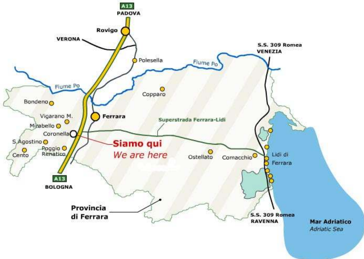
Distanze - località Provincia di Ferrara

Oltre a Ferrara, nelle immediate vicinanze ci sono le seguenti località della provincia di Ferrara: Vigarano Mainarda, Mirabello, S. Agostino, Cento, Poggio Renatico.